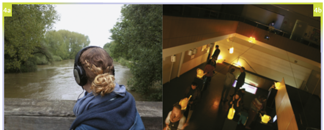
Bildpaar 4 Die neuen Medien ermöglichen neue Vermittlungs- und Wahrnehmungsweisen draußen und während der langen Nacht der Forschung 2012.

Professionelle Radiojournalisten und Klangspezialistinnen nutzen den zunehmend attraktiven auditiven Wahrnehmungskanal schon länger. Hier setzt das EFRE-Ausgründungsprojekt: »Tonspur Stadtlandschaft« von Stefanie