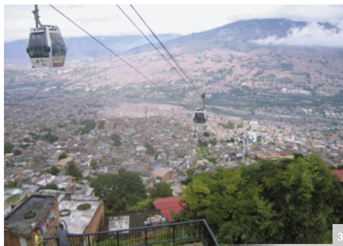
Abbildung 3 Informelle Stadtquartiere können Hunderttausende von Stadtbewohnern beherbergen, wie im Falle der Nordosthänge Medellins. Stadtplaner bessern heute diese Viertel mit innovativer Infrastruktur (in Medellín Drahtseilbahnen), öffentlichen Einrichtungen und Freiräumen nach.

Menschen sind überrascht, wenn Sie von dem breiten Aufgabengebiet eines Landschaftsarchitekten hören. Es umfasst inzwischen jede erdenkliche Fläche – von der Umwandlung kontaminierter Industriegebiete bis zur Unterwasserinstallation von künstlichen Austernfeldern. Traditionelle Vorstellungen, dass Landschaftsarchitekten hauptsächlich die Privatgärten reicher Leute gestalten, sind seit langem überholt; der Großteil der Landschaftsarchitekten bestreitet heute seinen Unterhalt im öffentlichen und halb-öffentlichen Raum. Darüber hinausgehend streben Landschaftsarchitekten eine Führungsrolle unter den zahlreichen Planungsdisziplinen im notwendigen ökologischen Umbau unserer Städte an.