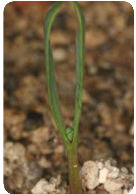
Dieser Sämling ist erst zwei Wochen alt.

vermutlich erstmals im Botanischen Garten des Schlossparks Schönbrunn in Wien.