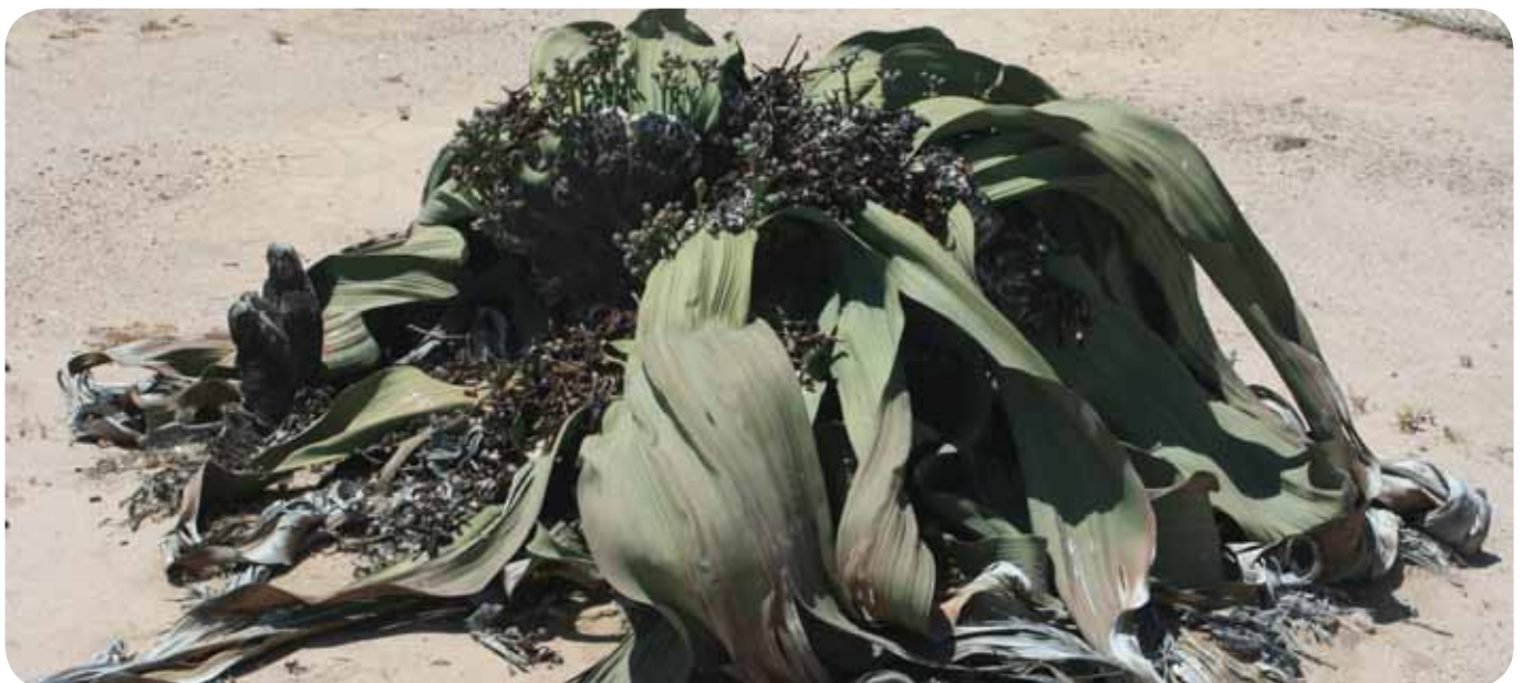
Diese Welwitschia am Naturstandort auf dem Welwitschia-Drive in Namibia nahe Swakopmund ist eine der ältesten überhaupt und rund 1500 Jahre alt. Auch wenn es anders aussieht, auch diese Pflanze hat nur zwei Blätter, die mit der Zeit ausfransen und bis zu acht Meter lang werden.

Verwandtschaftlich steht Welwitschia so isoliert da, dass man für sie nicht nur eine eigene Gattung, sondern auch eine eigene Familie begründete, die Welwitschiengewächse ( Welwitschiaceae ), mit nur einer überlebenden Art. Sie gehört wie Koniferen, Ginkgo und Palmfarne zu den Nacktsamern, und die nächsten lebenden Verwandten sind die Gattungen Ephedra und Gnetum . Kurioserweise wurden mögliche fossile Verwandte, die unter anderem als Welwitschiophyllum beschrieben wurden, im Nordosten Brasiliens gefunden. Zu Lebzeiten dieser Fossilien, vor gut 100 Millionen Jahren, war jedoch der Superkontinent