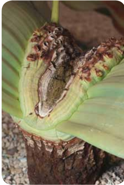
Dies sind Stamm und Zentrum der Pflanze.