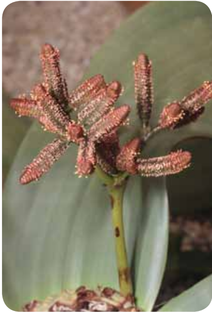
So sieht ein männlicher Blütenstand aus.