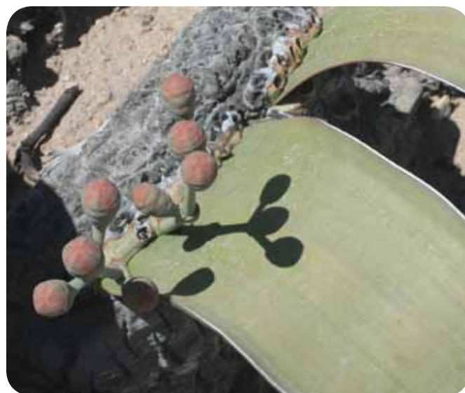
Die männlichen Pflanzen produzieren Pollen, während – wie hier im Bild zu sehen – die weiblichen Pflanzen Zapfen mit Samen tragen.

Die Entdeckung Welwitschs sorgte für Aufregung gleichermaßen in der wissenschaftlichen Welt wie bei der interessierten Öffentlichkeit. Die außergewöhnliche Pflanze wurde in eine Reihe gestellt mit anderen sensationellen Entdeckung dieser Zeit, wie der parasitischen Pflanze Rafflesia arnoldii , mit ihren riesigen Blüten, und dem kurz zuvor entdeckten Gorilla: „Eine Bildung der organischen Natur, in ihrer Art merkwürdiger und abenteuerlicher als der vielbesprochene Gorilla“ (Illustrierte Zeitung, 1864). Die Kultur der Welwitschia in Europa gelang erst viele Jahre später,