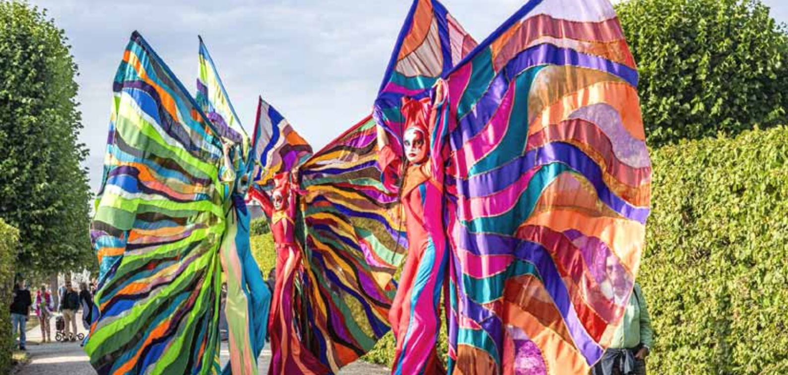
Stelzenkünstler vom Teatro Pavana freuen sich schon, mit ihren farbenfrohen Flügeln die Gäste zu verzaubern.